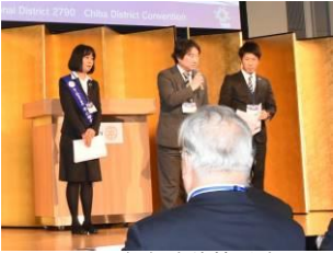
ロータリー学友連絡協議会