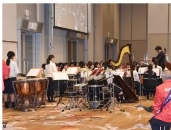
■アトラクション 成田高等学校 ・同附属中学校音楽部