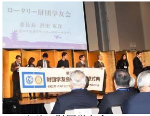
ロータリー財団学友会