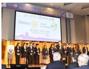
青少年交換委員会