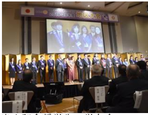
米山記念奨学生・学友会